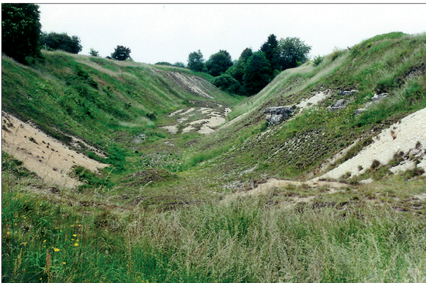
Abb. 2: Schwermetallrasen im NSG „Bleikuhlen“ in Lichtenau-Blankenrode

In Ostwestfalen südlich von Lichtenau-Blankenrode im Kreis Paderborn liegt das Naturschutzgebiet „Bleikuhlen“ (Abb. 1). In den hier anstehenden Kalkgesteinen der Oberkreide (Cenoman) finden sich Zink- und Bleierz, welche auch oberflächennah vermutlich seit dem 12. Jh. bis zum Jahre 1939 abgebaut wurden (Abb. 2). Weitere solcher natürlicherweise durch Schwermetalle geprägten Standorte existieren z. B. im Aachener Raum bei Stolberg. Bei Botanikern sind die „Bleikuhlen“ besonders bekannt, da es hier eine Reihe von an diesen Extremstandort angepassten Pflanzenarten gibt. Dazu zählen u. a. Galmei-Frühlingsmiere ( Minuartia caespitosa ), Galmei-Leimkraut ( Silene vulgaris s.l. var. humilis ), Wiesen-Schaumkresse ( Arabidopsis halleri ) sowie Galmei-Hellerkraut ( Thlaspi calaminare ), die alle auch an anderen Schwermetallvorkommen in Mitteleuropa wachsen. Die große Besonderheit