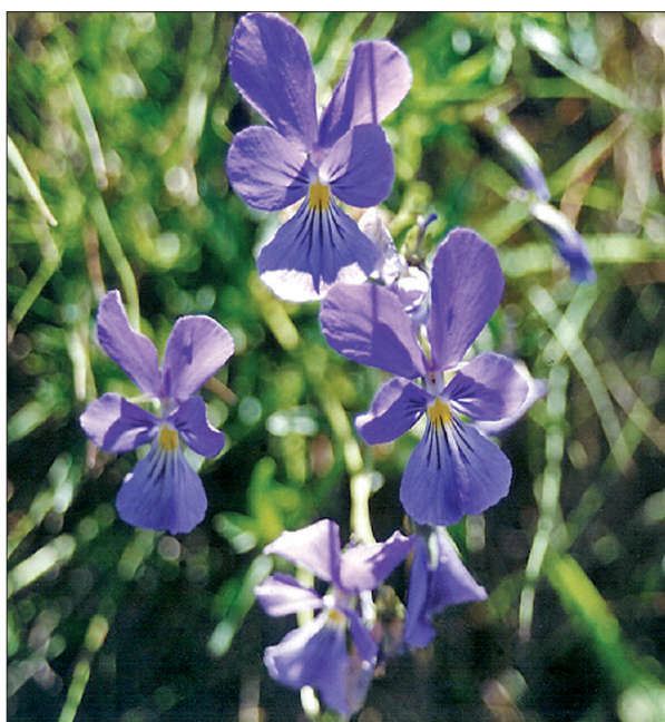
Abb. 3: Westfälisches Galmei-Veilchen ( Viola guestphalica )

ist das hier punktendemische Westfälische Galmei-Veilchen ( Viola guestphalica , Abb. 3), welches weltweit nirgendwo anders vorkommt als in den „Bleikuhlen“ und an einer Stelle im Wäschebachtal in nur 1,5 km Entfernung (Abb. 1). Auch der vorhandene Schaf-Schwengel ist eine endemische, noch nicht gültig beschriebene Art ( Festuca pseudauisgranensis ined.), die sonst vielleicht noch im nahen Briloner Raum vorkommt, wogegen die ähnlichen Aachener Schwermetall-Populationen nur zu einer sehr nahen Verwandten ( Festuca aquisgranensis ) gehören.