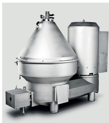
Abb. 4: Separator für die Herstellung von Doppelrahmfrischkäse aus fetthaltiger Milch mit einem Fettgehalt von 8–12 %

mie-, Pharmazie- und Umwelttechnik. Damit gilt das Unternehmen als ein Hidden Champion in Westfalen. In Oelde sind im Jahr 2025, über 130 Jahre nach Gründung des Unternehmens, rd. 1.900 Mitarbeitende beschäftigt, davon 180 Auszubildende in 9 Berufen und 7 dualen Studiengängen. Oelde ist damit der größte Standort der GEA-Group weltweit. An der Werner-Habig-Straße werden auf über 85.000 m 2 Produktionsfläche die Hauptprodukte Separatoren (Abb. 4) und Zentrifugen, Dekanter und Anlagen (Komplettlösungen) hergestellt und ständig weiterentwickelt – mittlerweile natürlich auch mit digitalen Sensoren, intelligenten Steuerungen und künstlicher Intelligenz versehen. Immer wichtiger wird dabei auch der möglichst geringe Energieverbrauch der Anlagen. Um den Standort auch langfristig abzusichern, wurde im Jahr