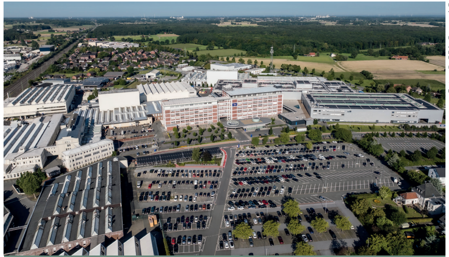
Abb. 3: GEA Westfalia Separator-Gelände, westlich der Oelder Innenstadt

Aus den Unternehmens-Wurzeln entwickelte sich der heutige GEA Standort in Oelde. Hier befindet sich das nach eigenen Angaben weltweit modernste Separatorenwerk (Abb. 3). Die Produkte „made in Oelde“ werden in alle Welt geliefert. Die Exportquote liegt aktuell bei über 80 %. Abnehmer sind vor allem die Nahrungs- und Getränkebranche, die Schifffahrt/Marine, die Öl- und Gasbranche bis hin zur Energie-, Che-