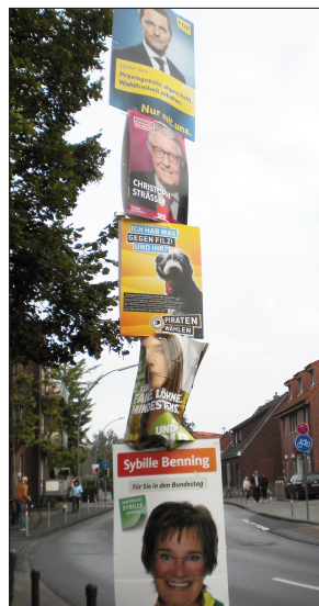
Abb. 2: „Plakatmast“ in Münster-Roxel

Zwar sahen 17 Mio. das angeblich entscheidende TV-Duell der beiden Spitzenkandidaten Merkel (CDU) und Steinbrück (SPD), aber neuen Schwung brachte auch dieses Aufeinandertreffen nicht. Dagegen weckten andere Formate wie die Wahlarena in der ARD (150 repräsentativ ausgewählte Wähler/-innen befragen direkt die Spitzenkandidaten) offenbar mehr Interesse. Traditionelle Formen des Wahlkampfs wie Plakatierung, Wahlwerbung in den audiovisuellen Medien, Infostände der Parteien oder auch die öffentlichen Auftritte der Spitzen- und Wahlkreiskandidaten traten jedoch keineswegs in den Hintergrund (Abb. 2).